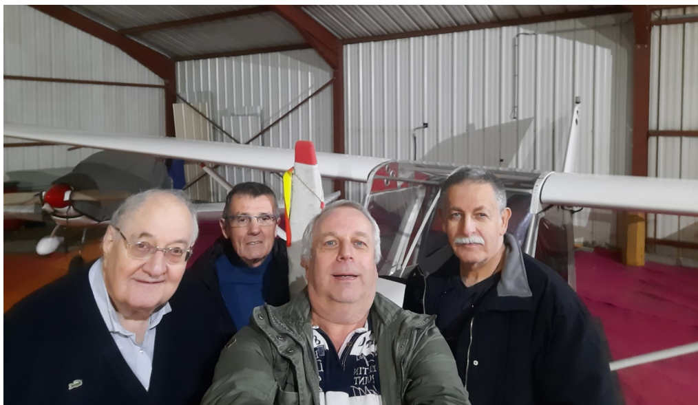
Photo du bureau, il manque le secrétaire, Jon Jamot, absent le jour où elle a été prise.

Et dans un futur proche, après la modification légale des statuts, la possibilité de faire venir un instructeur avec ses machines pour pouvoir former des jeunes pilotes désirant passer leur brevet et découvrir l'ULM dans notre superbe région.