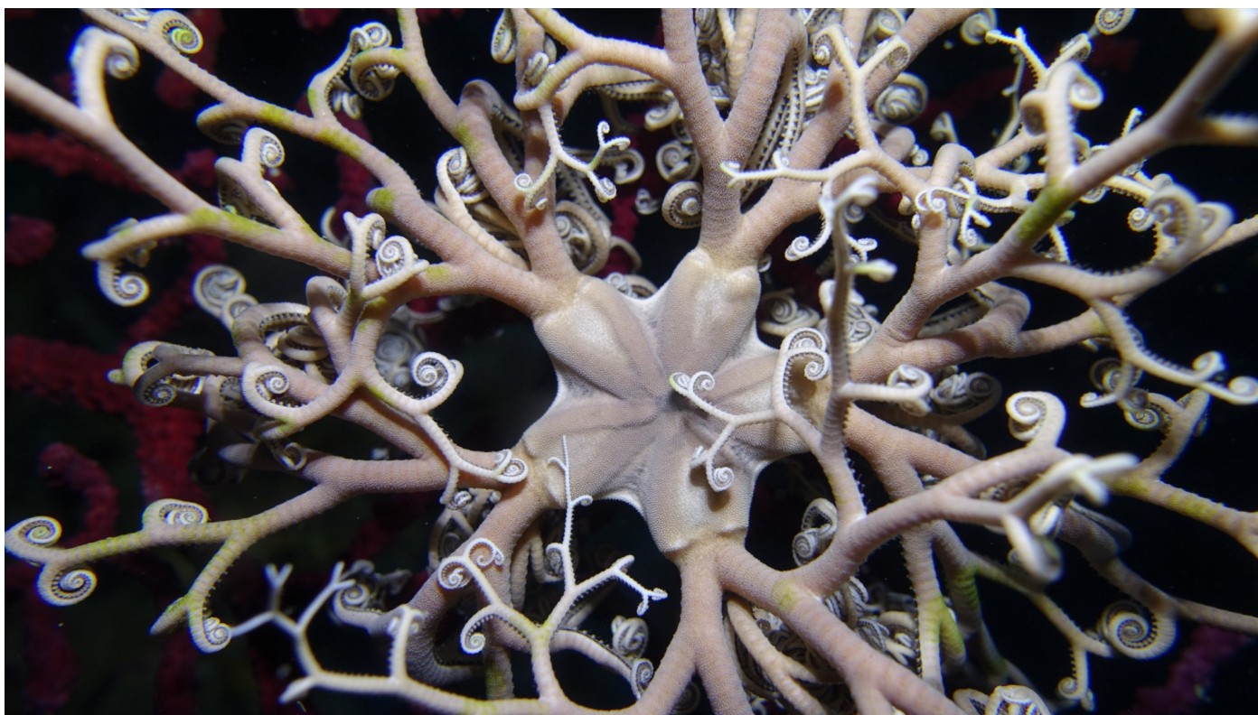
GORGONOCÉPHALE. Cet animal fait partie de l'embranchement des échinodermes (comme l'étoile de mer). On le trouve lors des plongées profondes, le plus souvent au-dessous de 40 mètres de profondeur.