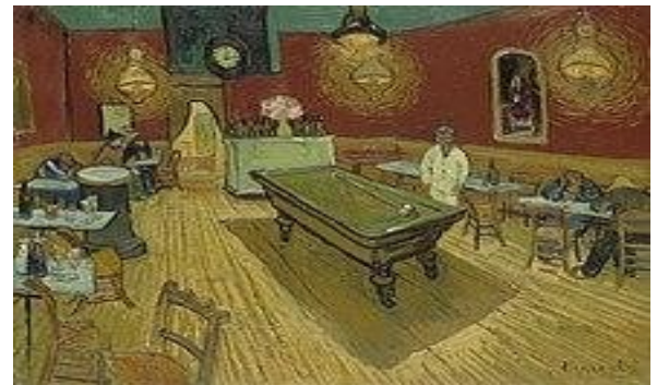
Café de nuit. Peinture de Vincent van Gogh

En 1961, la série télévisée « la 4 ème dimension » a consacré un épisode intitulé « le joueur de billard ».